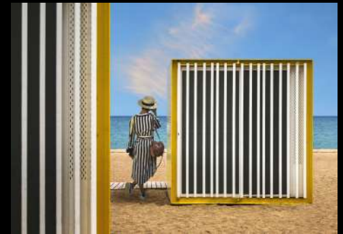
Argazkia: Primeras líneas de mar - Diego Pedra

Edozein zalantza edo kontsultarako: concurso.nikolaslekuona@gmail.com