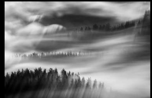
Argazkia: Laino Orrazia - Imanol Zubiaurre