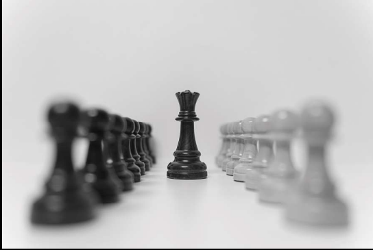
Argazkia: Army of Pawns - Jose Ignacio Rodriguez