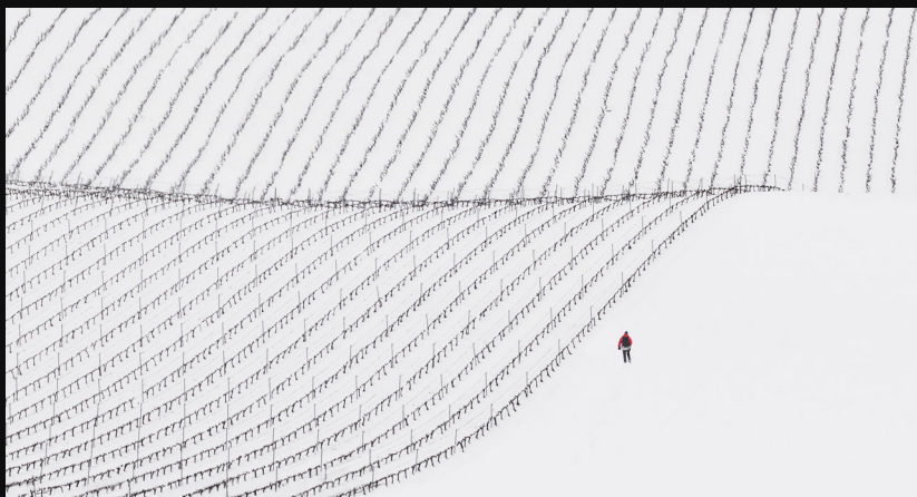
'LEGAZPI HIRIA' PREMIO 2018 SARIA Entre viñas - Pablo Pérez Herrero

Estatu Mailako XX. Argazki Lehiaketa XX Concurso Estatal de Fotografía