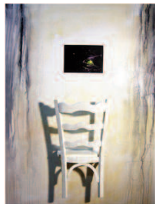
Bat eta hiru UBU Uno y tres UBÚS

gica". Un escudo de resistencia mental contra lo establecido. La inventó Alfred Jarry, escritor francés de finales del siglo XIX. De él nacieron todas las vanguardias. Ya en la segunda mitad del siglo XX se consolidó como movimiento cultural francés y desarrolló todo su potencial basado en el libro "Gestas y opiniones del Doctor Faustroll, patafisico", y en la obra de Teatro "Ubu Rey" que Alfred Jarry escribió a finales del siglo XIX. La Patafisica se asocia al absurdo y toma en clave paródica el lenguaje institucionalizado de las ciencias, la filosofía, las artes y otras formas de conocimiento.