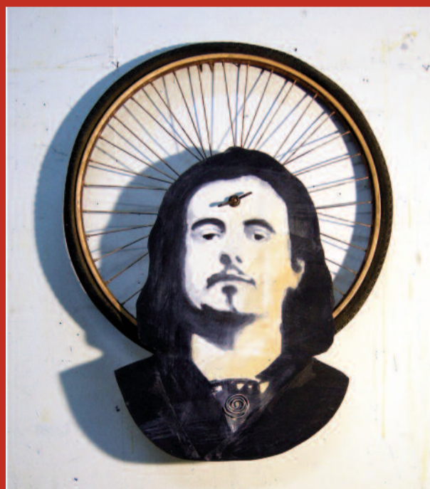
ALFRED JARRY Alegiazko problemen konpontzailea Solucionador de problemas imaginarios

Kepa Junkera ren laguntza berezia izan dugu. Izan ere, era- kusketarako adierazkortasun handiko pieza bat konposatu du: "Suite 'Patafisica'" 4 mugimendutan.