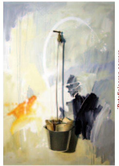
'Patafisicaren sorrera El nacimiento de la 'Patafisica