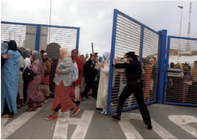
Batzuetan beharrezkoa da muga-postua aldibaterako ixtea. En ocasiones, es necesario el cierre temporal del paso fronterizo.