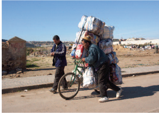
Beni Enzar mugarako bidea, Melillan. Camino de la frontera de Beni Enzar, en Melilla.

Miles de personas esperan en las costas marroquíes y en Ceuta una oportunidad de cruzar al otro lado, a una vida mejor en Europa. Por esa estrecha franja de agua, una de las de mayor tráfico marítimo del mundo, circula de todo, se detectan desde embarcaciones de recreo a mercantes o motos de agua con droga, el hachís es el producto "estre-