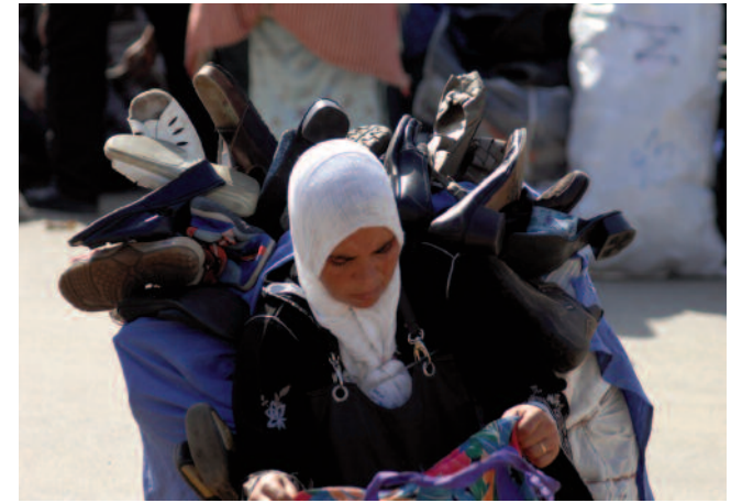
Emakume bat bere zamarekin. Una mujer, con su cargamento.

Este "mercado" de viajes clandestinos funciona como una verdadera empresa. Los inmigrantes que se lanzan en balsas o a nado con la idea de