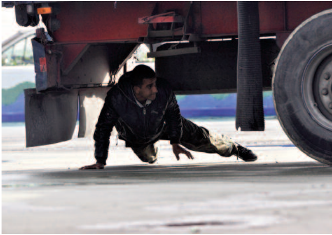
Etorkin bat kamioi baxuetan ezkutatzeko ahaleginetan. Inmigrante tratando de esconderse en los bajos de un camión.