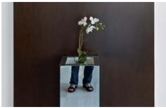
Autorretrato. Orquídea, Valencia, 2011.