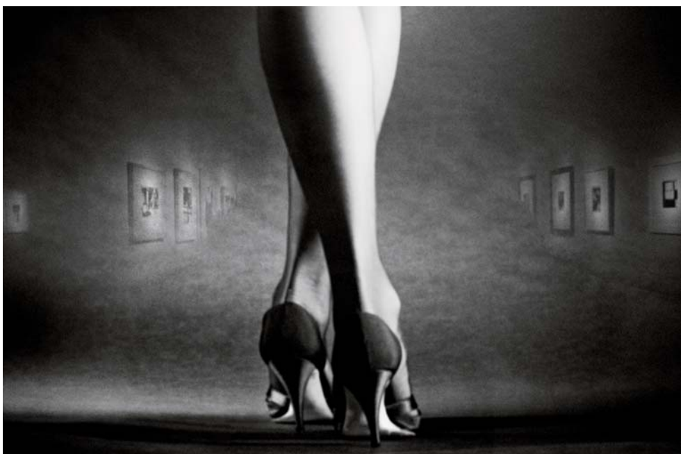
De la serie “A propósito...” Horst P. Horst ( Round the Clock ), 2008 Lo que se recuerda ha sido salvado de la nada (John Berger)