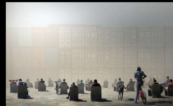
Argazkia: Expectación - Diego Pedra - Cornellà de Llobregat, Barcelona