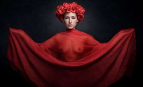
Argazkia: Noe in Red 04 - Manu Barreiro - Beasain, Gipuzkoa