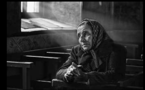
Argazkia: Pray - Jose Beut - Valencia