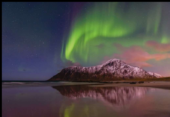
Argazkia: The Green Lady - Jose I. Rodriguez - Ordizia, Gipuzkoa