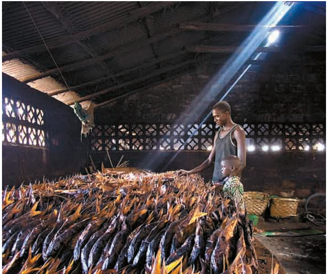
Gambian arraina lehortzeko leku bateko argazkia: Secadero de pescado .

Garai batean argazki kamera analogikoa erabiltzen bazuen ere, digitala hartzen du orain. «Analogikoa oso ona zen, baina asko pisatzen zuen». Argazki kamera digitalaren arintasuna eskertzen du, baina datozen bidaietan pisu handiago hartu beharko duela dio; izan ere, zenbaitetan behar zuen materiala eskura ez izateagatik argazkiren bat edo beste atera gabe geratu da, eta ez du berriz ere gertatzerik nahi argazkilari barakaldarrak.