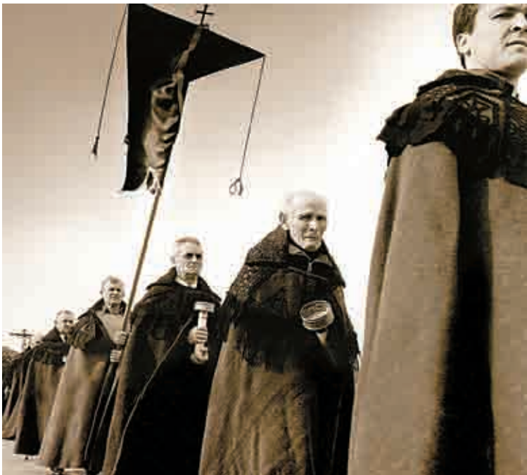
Espanian, Zamoran, prozesio bat: Bercianos .