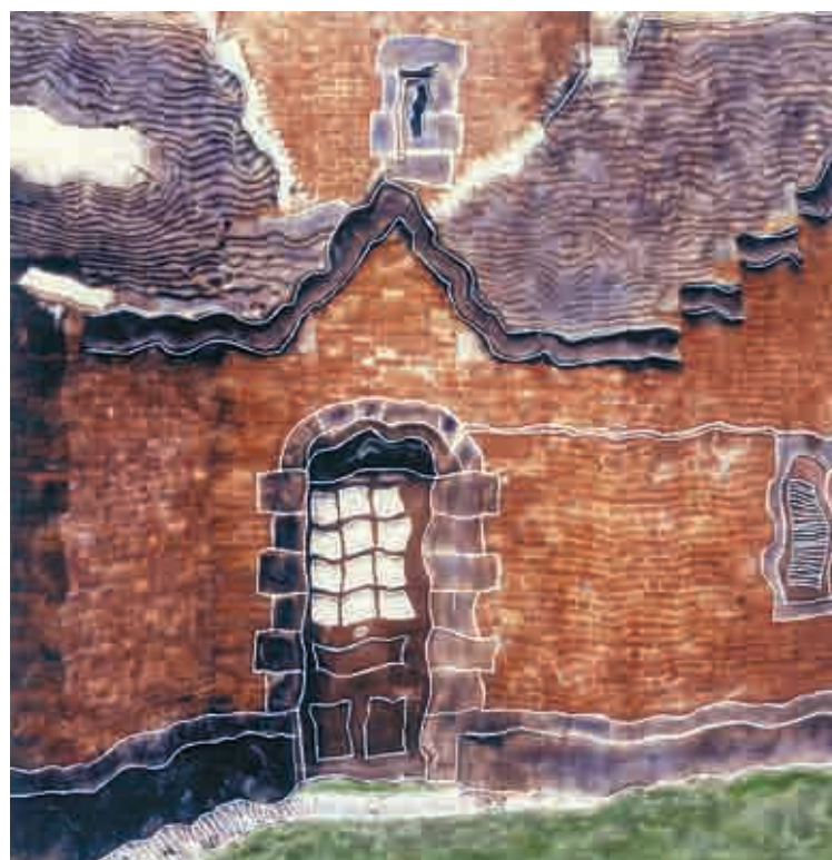
'Miramar jauregia II'. Polaroid marraztua.

Erretratu asko egin izan ditu, eta egiten ditu, baina paisaiak gehiago. Bai hirian bai natur inguruetan. Mendizalea da. «Ez zait natura hila egitea gustatzen». Orain, hurrekin ez du denbora askorik, baina badu asmoa eta gogo argazkigintzari ordu gehiago eskaintzeko. Argia bilatzen du argazkietan; «arratsaldeko eta egunsen-