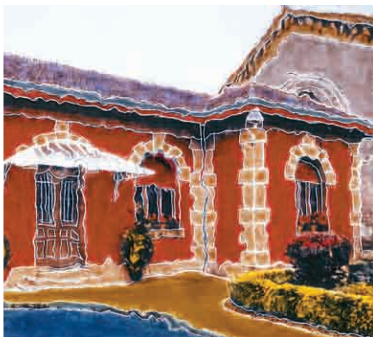
'Gas lantegia'. Polaroid marraztua.

tiko argia. Basoak urre kolorez janzten diren une hori izaten da ederrena.