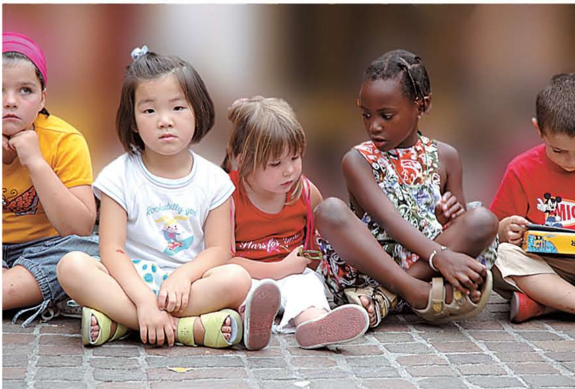
Haurrak ikuskizun bati begira Hondarribian.