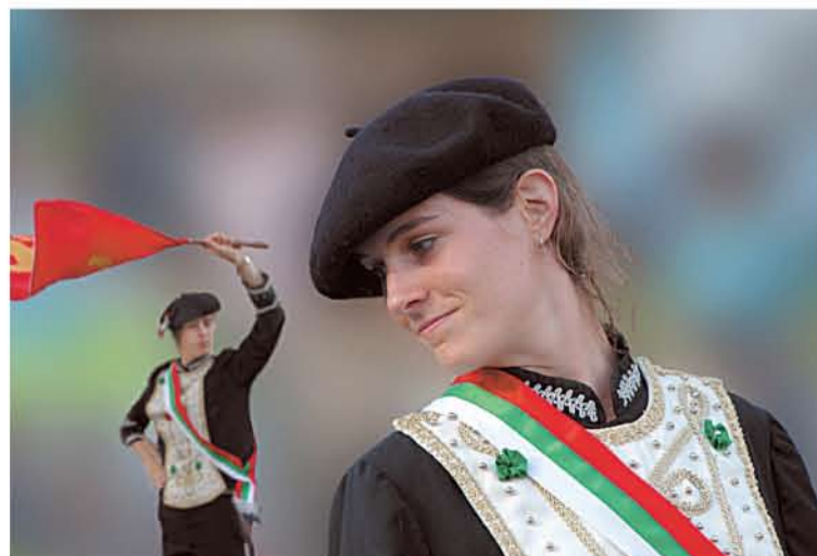
Irungo Euskal Jiran ateratako irudiak, ordenagailuan moldatuak.