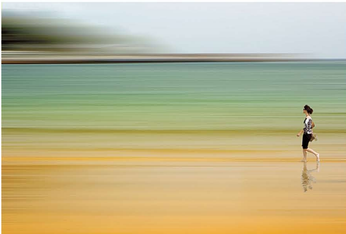
Hondarribiko hondartzan ateratako argazkia. Argazki digitala da, ondoren ordenagailuan landua.