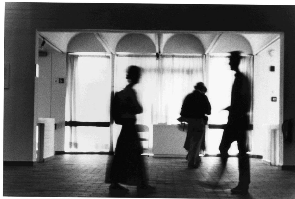
Egilea: J.L.Irigoin (2005ko irabazlea)