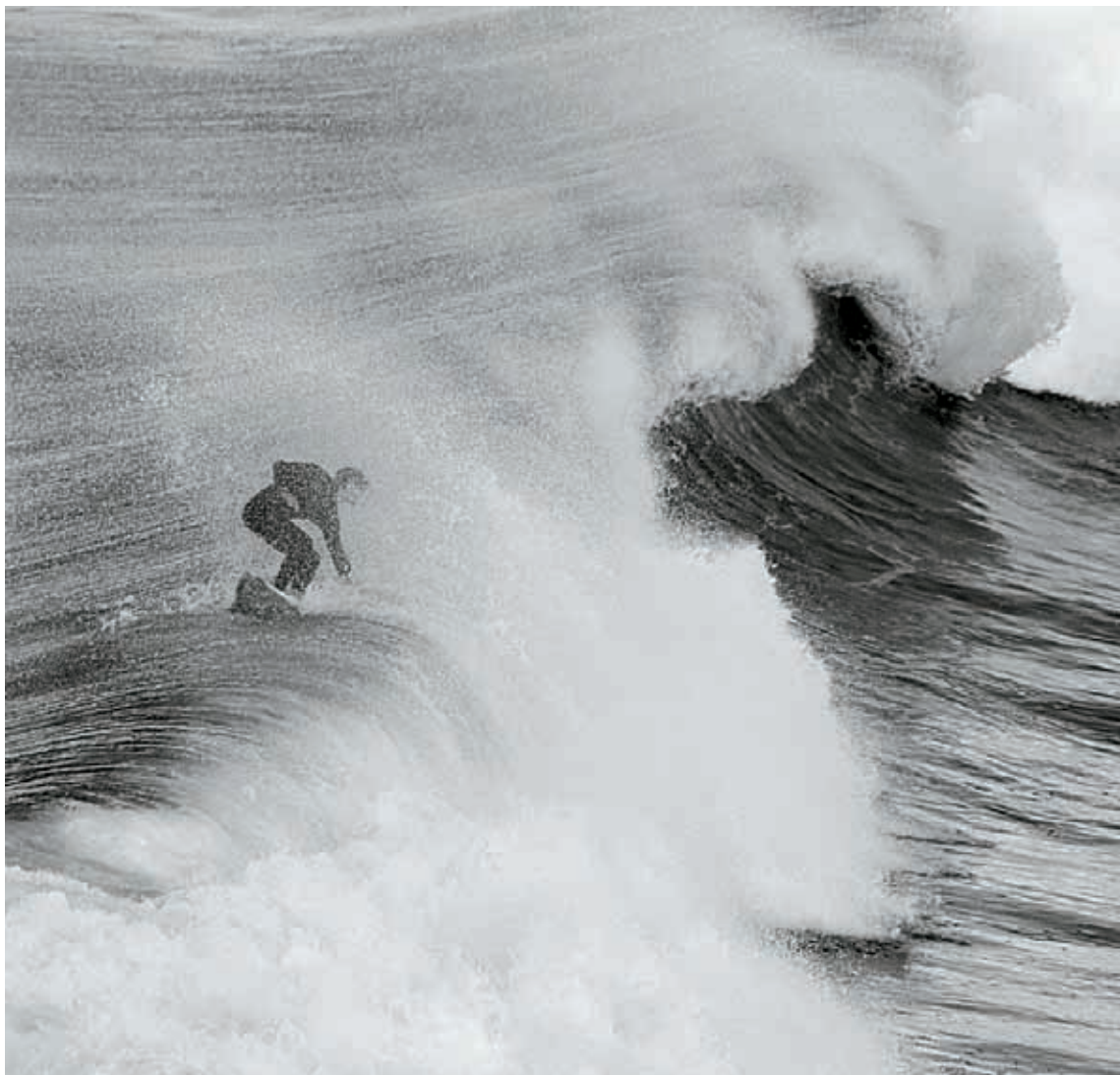
Itsasoa. Surflaria olatu gainean.